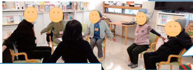
おしゃべり サロンの 様子