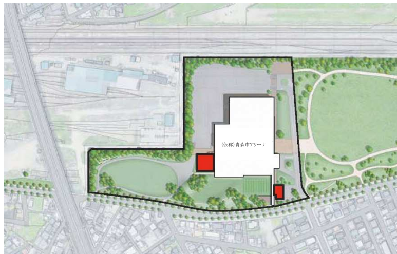
青い森セントラルパーク配置図