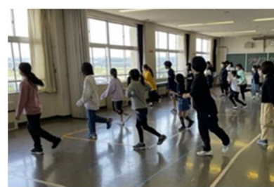
ダンスクラブ活動サポート（油川小学校）

【内容】 昨年度ワークショップ実施校へのフォローアップとして、クラブ活動に地元ダンサーを派遣