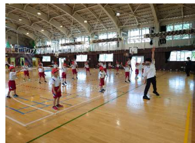
ダンスワークショップ（原別小学校）

【内容】 オリジナルプログラム（①ストレッチ ②マット運動 ③リズムジャンプ ④コレオ（振り付け））を用いたレッスン