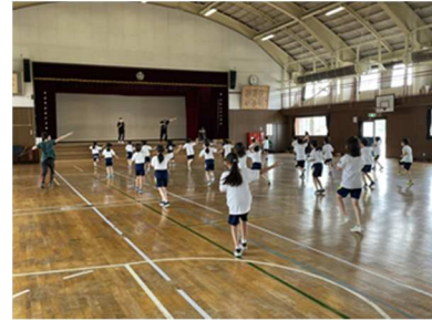
ダンスワークショップ（泉川小学校）

誰もが楽しみながら身体の動かし方を学ぶことができ、中学校教育課程の必修科目でもあるダンスを活用し、気軽にスポーツに親しむ機会の創出と交流促進により、スポーツ人口の拡大とともに地域の活性化を図ることを目的に、新型コロナウイルス感染症感染予防対策を踏まえ、ダンスを生かしたスポーツ振興事業を実施しています。