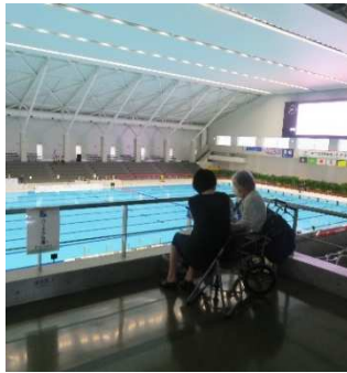
福祉（ハートフル）席