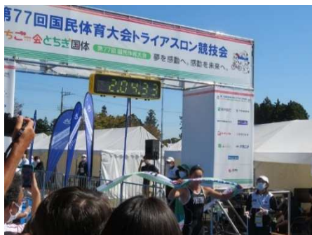
トライアスロン競技（ゴール）