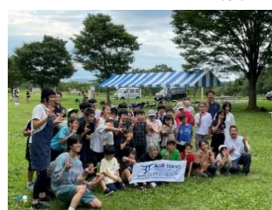
ダンス×デイキャンプ(記念撮影)