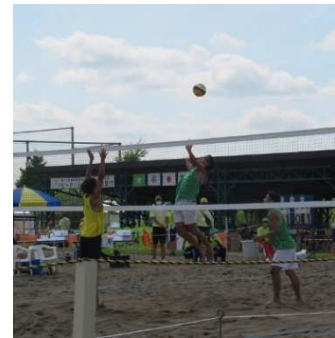
ビーチバレー競技