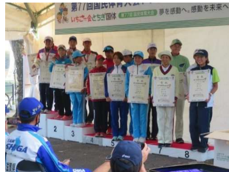
トライアスロン競技（表彰式）