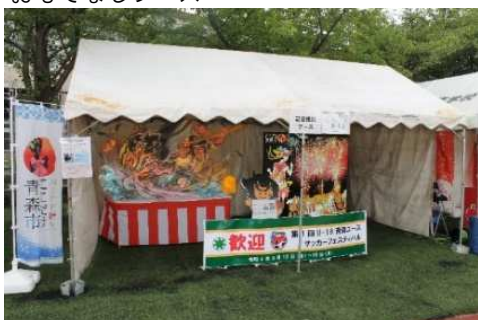
おもてなしブース