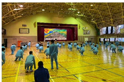
R3 ダンス授業サポート（油川中学校）