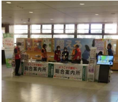
総合案内所・カウントダウンボード