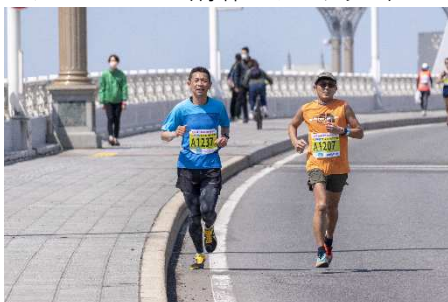
マラソンコース（青森ベイブリッジ）