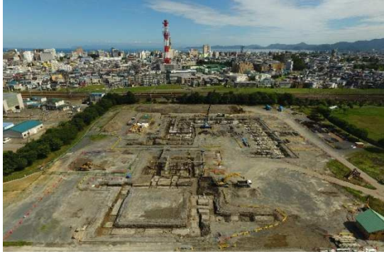
南側から（R4. 8. 25 撮影）