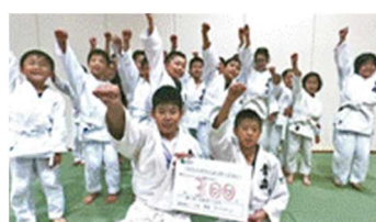
<カウントダウンメッセージ>