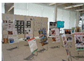
<東京 2020 大会 PR 展示>