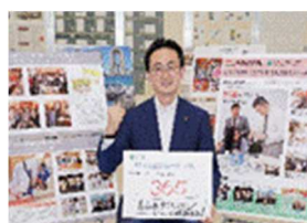
1 年前 青森市長