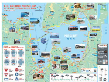
多言語パンフレット