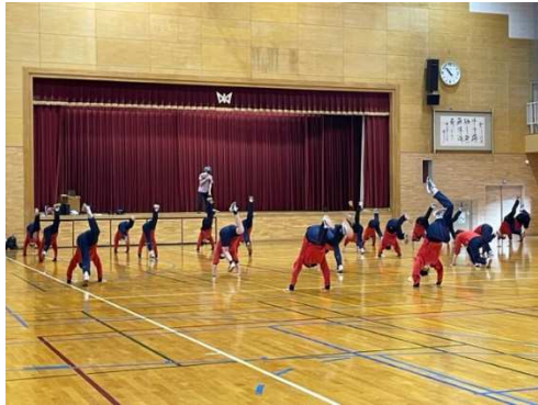
R4 ダンス授業サポート（甲田中学校）