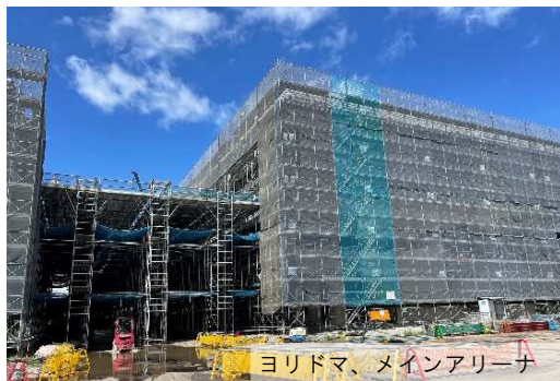
ヨリドマ、メインアリーナ