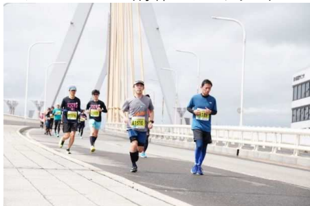
マラソンコース（青森ベイブリッジ）