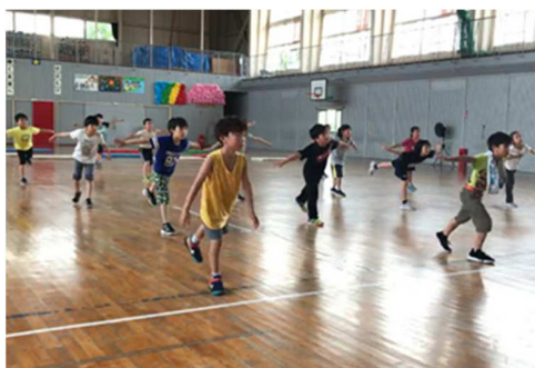
ダンスワークショップ（千刈小学校）