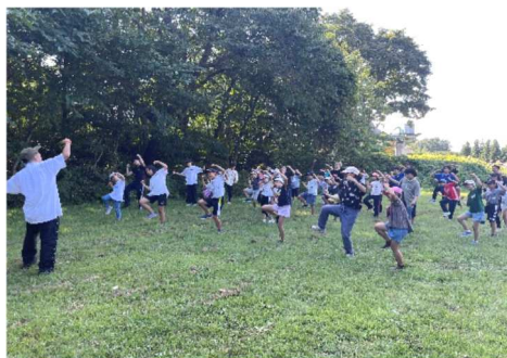
ダンス×デイキャンプ①