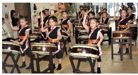
オープニングセレモニー いしえこども園