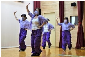
サークルナチュラル