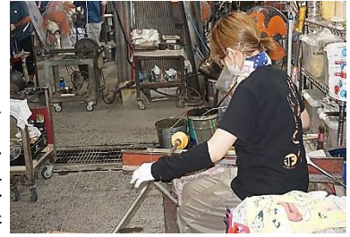
ガラスを熱して、模様を整える

北洋硝子は昭和24年設立。漁網につける浮球の製造から始まりました。その後、ガラスの浮球がプラスチック製に代わってしまうと、花瓶作りに転進し、そのブームが去るとテーブルウェア製品に変えて、平成8年に「津軽びいどろ」が誕生しました。今では「スターバックス」他との多くのコラボ製品やアメリカの美術館から大量発注を受けるまでになりました。70名ほどの従業員の多くが青森市出身ということで、故郷を代表する会社だと思いました。