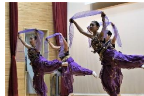
子どもバレエクラブ