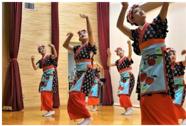
津軽なでしこ 津軽じょんがら節