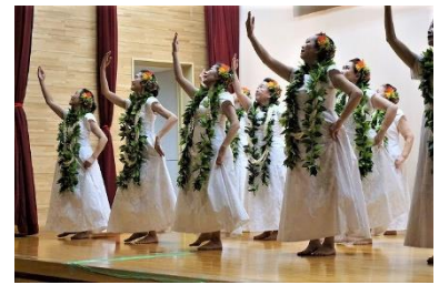
ハイビスカスフラクラブ

10月19日(土)・20日(日)に、西部市民センターまつりが開催されました。作品展示や作品づくりを体験できるコーナー、バレエストレッチ無料体験、ニュースポーツ体験、食堂、ちびっ子出店など、とても賑わいました。20日の芸能発表では、ダンス・踊り・コーラス・カラオケなどたくさんの演目が披露されました。