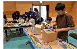
新城中ダンボールアート