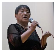
カラオケサークル「穂のか」「うぐいす」「ふれあい」