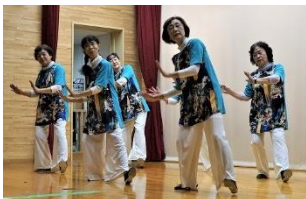
のぞみレクダンス

10月19日(土)・20日(日)に、西部市民センターまつりが開催されました。作品展示や作品づくりを体験できるコーナー、バレエストレッチ無料体験、ニュースポーツ体験、食堂、ちびっ子出店など、とても賑わいました。20日の芸能発表では、ダンス・踊り・コーラス・カラオケなどたくさんの演目が披露されました。