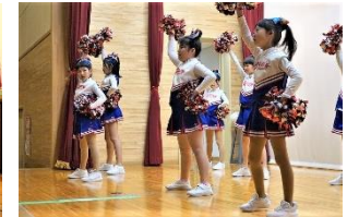
ウルトラキッズチアーズ