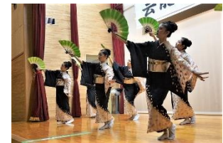
津軽なでしこ 津軽よされ節