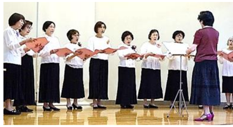
コーラス 戸山フレンズコール