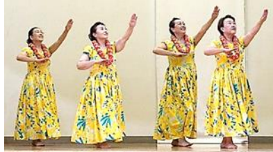
フラダンス フラサークル マカラプア