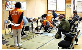
戸山地区健康づくり リーダー会