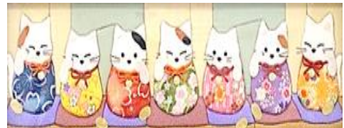
手芸 手芸サークル 手づくり空間