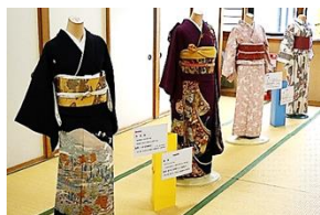
着付け たちばなの会