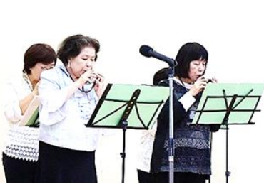
オカリナ演奏 オカリナサークル響