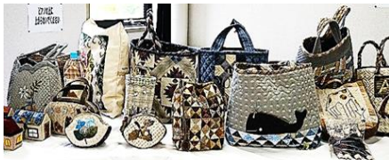
手芸 青森市民大学・大学院 戸山校