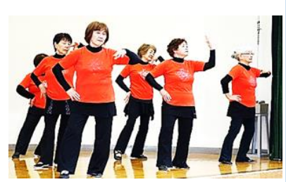
レクダンス はつらつサークル

11月2日(土)、戸山市民センターまつりが5年ぶりに開催されました。サークルの作品展示やそば、コーヒーの軽食コーナーは賑わい、演技発表では、150席を用意した会場は超満員で、オカリナ演奏やコーラス、フラダンスや太極拳の演技が華を添え、抽選会も復活し、大盛況でした。