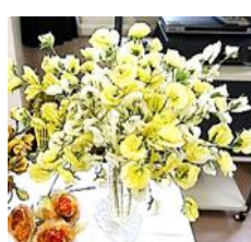
フラワーアート 戸山唄う会