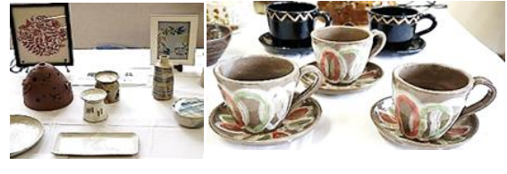
陶芸 陶友会(左) ユーカリの会(右)