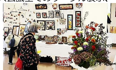
華やかな2階展示会場入口

11月2日(土) 戸山市民センターまつりを開催しました。新型コロナウイルス感染拡大で、4年間中止せざるをえなかった戸山市民センターまつりでしたが、大会議室でのサークル展示、和室での健康チェックなど、午後からは、体育館でサークル発表が行われました。軽食コーナーでは、そば、コーヒーなどの販売、体育館での抽選会もあり、大盛り上がりでした。5年ぶりの開催で、不安な面もありましたが、無事に終わることが出来ました。ご来館くださった皆様、戸山市民センターまつり開催に御協力いただきました地域の皆様、本当にありがとうございました。