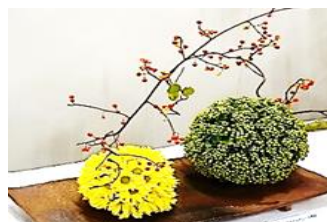
生け花 欧風花インスティテュート青森