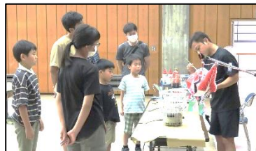
講師の説明を聞く参加者