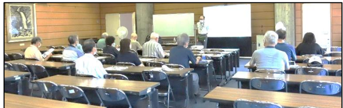
講師の説明に耳を傾ける参加者

参加者は、熱心にメモを取りながら、真剣に講師の話に耳を傾けていました。防災のための気象情報の種類が多いので戸惑いましたが、具体的で丁寧な解説で勉強になったとの感想も聞かれました。