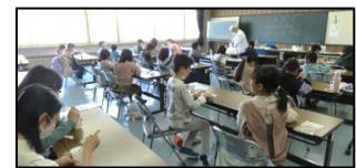
【スライム作りに熱中する児童】

スライム作りに熱中し、2時間の講座があっという間に終了しました。4種類のスライムを作ることができ、子どもたちは満足そうな笑顔でした。