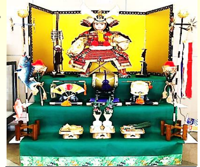
我らの力強い仲間『五月人形』