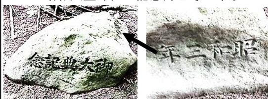
『御大典記念』(左)と『昭和三年』(右)