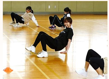
講師と一緒に「尺取虫」でGO！

今まで経験したことがない運動に呼吸は「ハーハーゼイゼイ」すかさず港講師から深呼吸と水分補給の指示。他にも、折り返しのコーン・パイロンを膨らまず、小さくターンすることを条件にしたリレー、ビニール袋に干支の龍を描いて空気を入れたマイボール（風船）をつくり、お手玉したり股の間を通したりする運動、港講師がスーパーのレジ袋を肩の高さから落とし、床に落ちる前に走ってキャッチする運動など、楽しいハードワークが続き、それこそ「冬休みの運動不足解消」の講座でした。