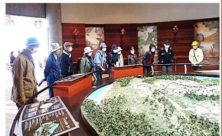
授業風景（三内丸山見学）