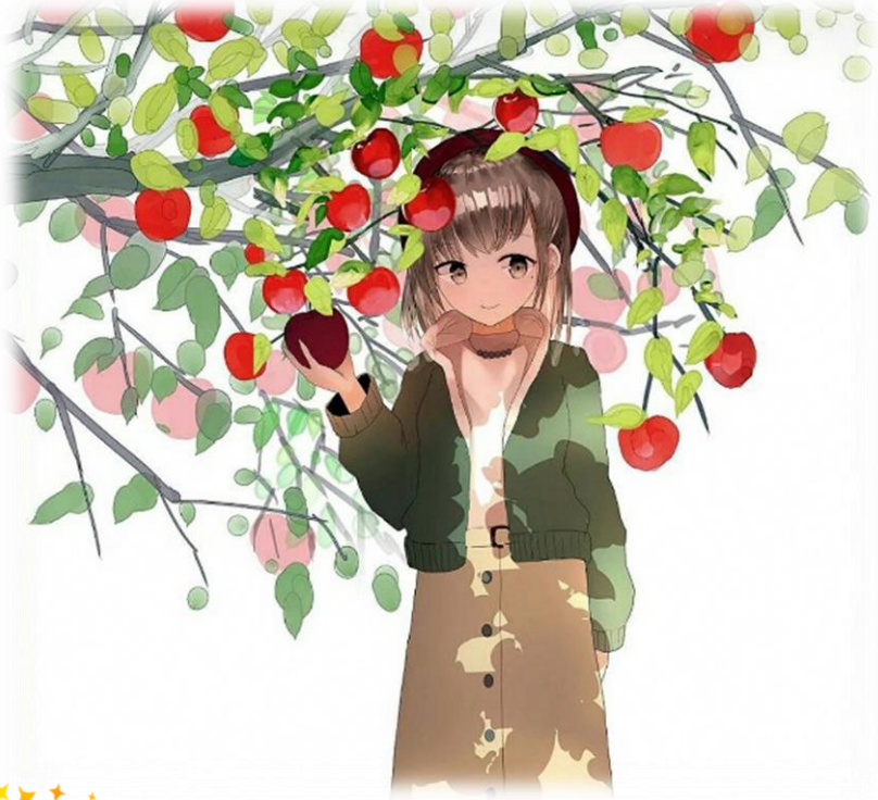
イラスト:青森公立大学3年 成田小姫