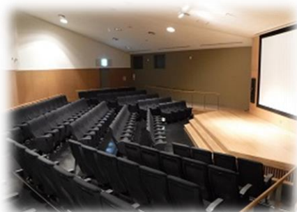
城跡案内所ホール