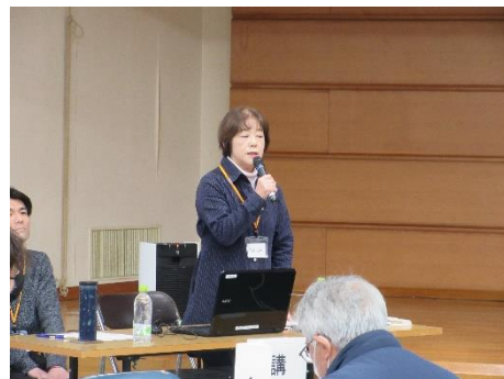
第8回 あおもり健康づくりリーダー会の発表