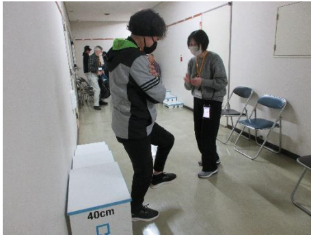
第7回 QOL 健診