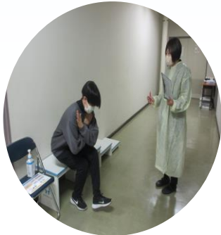
立ち上がりテスト