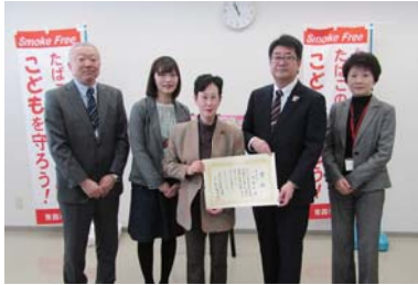
青森県がん生活習慣病対策課長から青森市保健所長へ賞状の授与

飲食店や事業者、地域の皆様とともに、「たばこの煙から子どもを守ろう!」をテーマに取り組んできた青森市の受動喫煙防止運動「スモークフリー・アクション」の功績が認められ、この度「第50回衛生教育奨励賞」を受賞しました! たばこの煙にさらされない環境づくりの実現には、多くの皆様の力が必要です! 今後市内全域へ受動喫煙防止の輪を広げていきます。