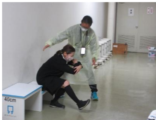
立ち上がりテスト