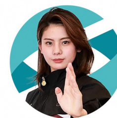
ケイト・ロータス