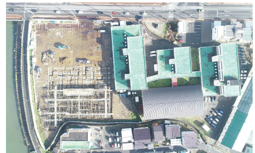
●工事状況(令和3年11月30日撮影)