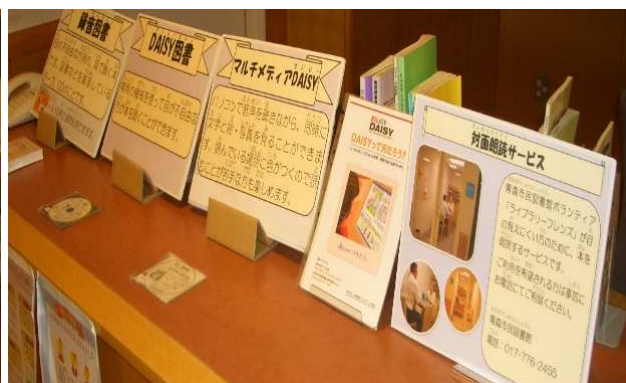
体の不自由な方へのサービスコーナー