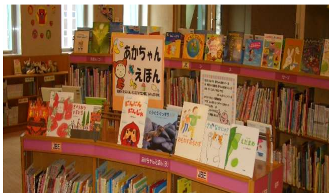
児童ライブラリー