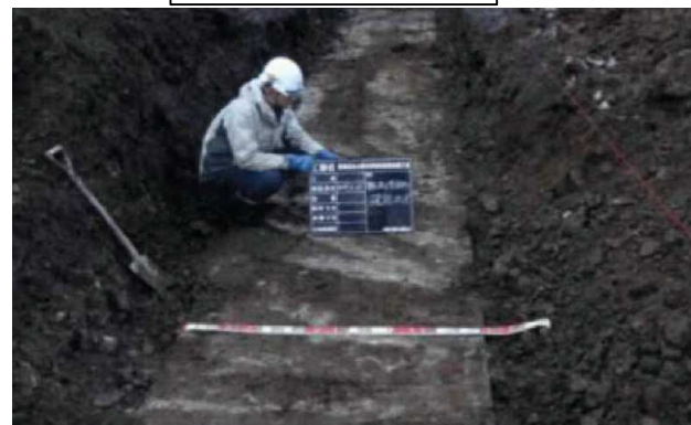
コンクリート製水路