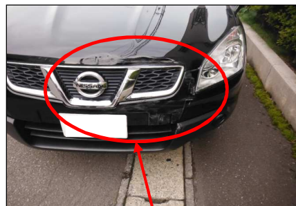
バンパー、ボンネット破損