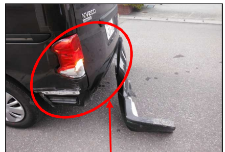
バンパー、ライト破損