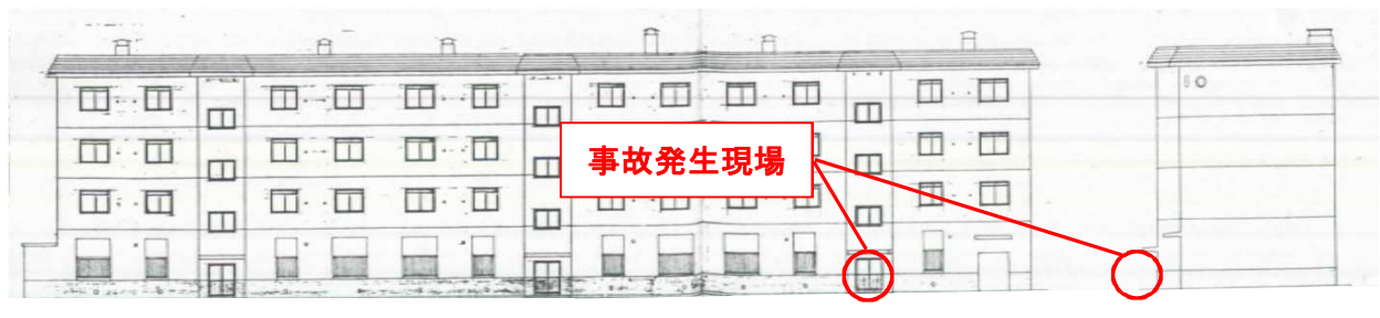
< 北側立面図 >