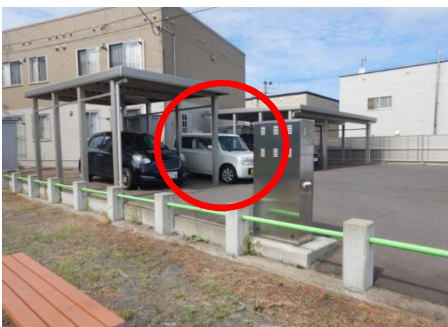
被害車両駐車箇所