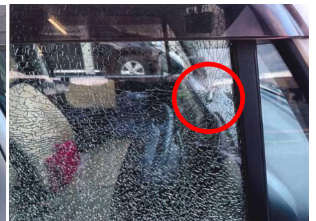
破損状況(飛び石飛散箇所)