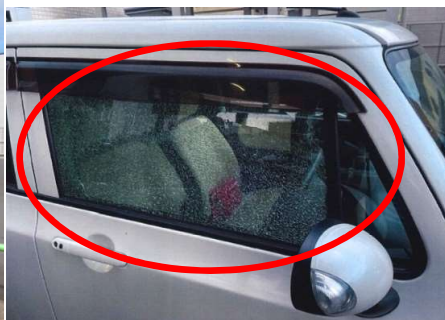
破損状況(運転席窓ガラス)