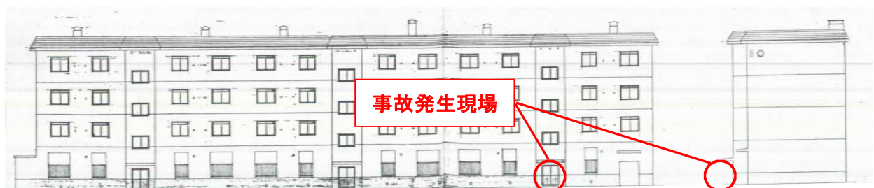
< 北側立面図 >