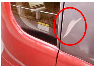
損傷箇所(右側後方ドアピラー)