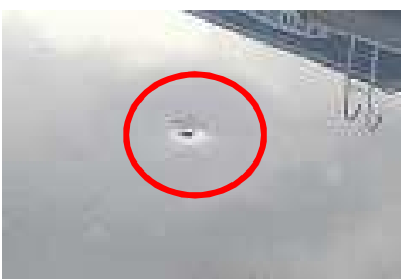
損傷箇所(車両屋根凹み)