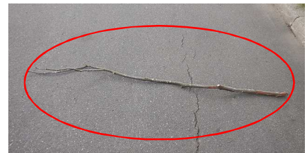
落下した枯れ枝 長さ:約2m、直径:約3cm 樹種:ケヤキ