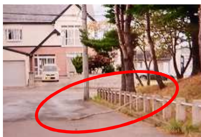
落下し飛び出した枯れ枝