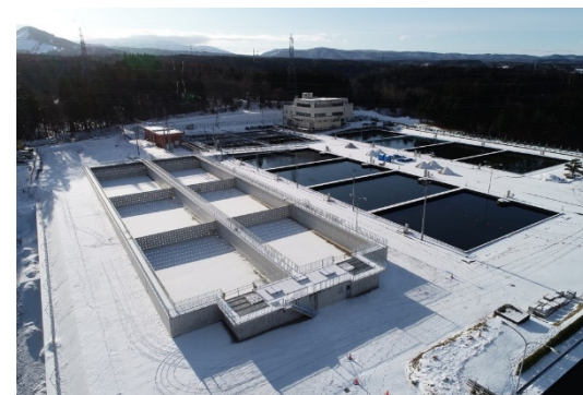
横内浄水場北系沈殿池の耐震化（R2年度）