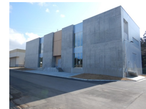
横内浄水場紫外線処理施設の導入（R3年度）