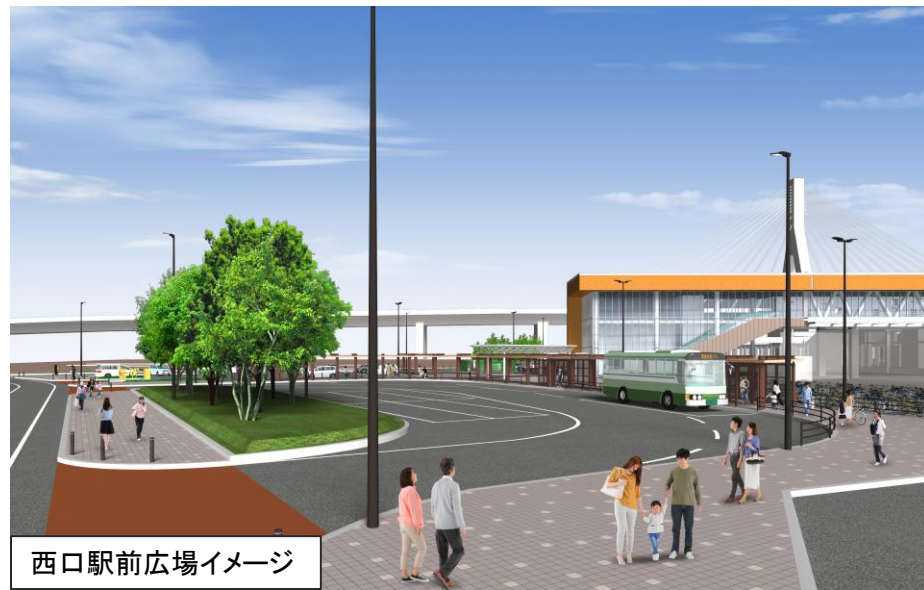
西口駅前広場イメージ