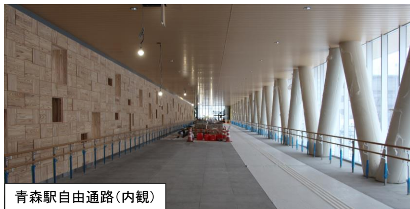
青森駅自由通路(内観)