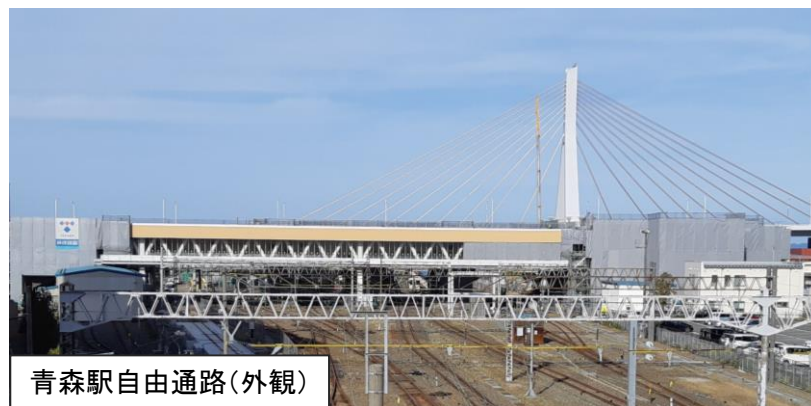
青森駅自由通路(外観)