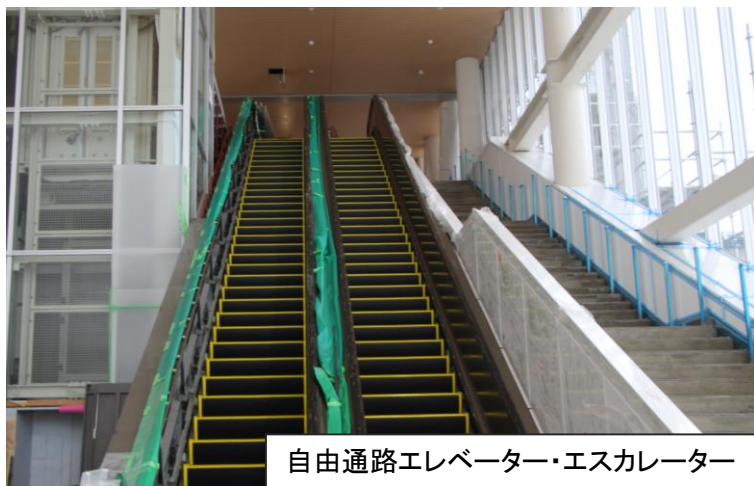
自由通路エレベーター・エスカレーター