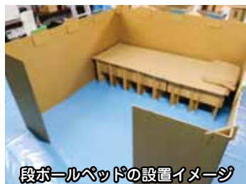
段ボールベッドの設置イメージ

Q 避難生活においては居心地やプライバシーの確保が課題となっておりますが、その改善のため、段ボールベッド等の備蓄や製造業者等と災害時の緊急提供に係る協定の締結を行ってはどうかと考えますが、市の考えをお知らせください。