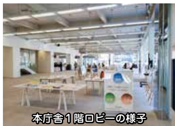
本庁舎1階ロビーの様子

Q 新市庁舎1階ロビーの利用について市民から聞かれることがありますが、市では市民利用のためのルールを定めているのか伺います。