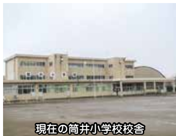
現在の筒井小学校校舎

Q 令和3年度から改築工事が始まる筒井小学校では、校舎等の改築中は校庭が使えなくなりますが、当該期間中における市教育委員会の対応をお示しく下さい。