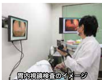
胃内視鏡検査のイメージ

Q 市が令和2年度当初予算案に計上している胃がん検診事業に係る拡充内容をお示しくください。