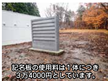
記名板の使用料は1体につき3万4000円としています。

A 合葬墓の使用資格は、市営霊園等の一般墓地使用許可を受けていない方で、本市に住所を有し、遺骨を保有する方や、満70歳以上で生前予約を希望する方等としており、申請受け付けは、遺骨を保有する方は本年6月1日から、生前予約は令和3年1月としています。