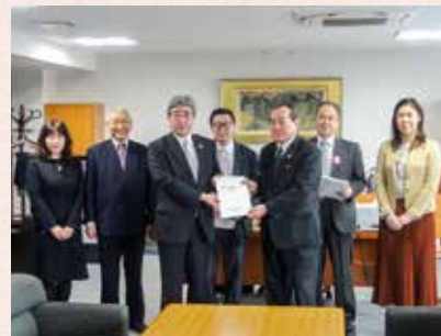
本年2月4日に特別作業班から全26項目の検討結果について、議長に答申がなされました。

市議会では、引き続き課題の解決に向けた検討を重ね、より市民にわかりやすい議会となるよう、努力してまいります。