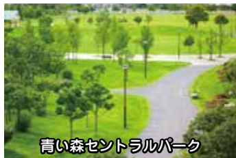
青い森セントラルパーク