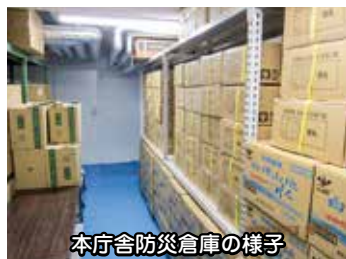
本庁舎防災倉庫の様子

Q さらなる市民の安心と安全の確保のため、来年度に市が拡充を予定している防災拠点機能整備事業の内容についてお示しください。