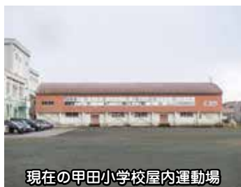
現在の甲田小学校屋内運動場

Q 甲田小学校屋内運動場は屋根全体がさびつき、住民から改修の声が上がっていたため、令和2年度当初予算案に改修に係る予算が計上されうれしく思いますが、当該改修の概要をお示しく下さい。