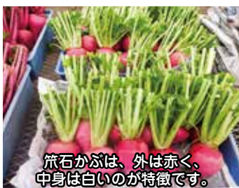
苜石かぶは、外は赤く、中身は白のが特徴です。

Q 市は令和2年度、本市の伝統野菜である苜石かぶの試験栽培をすることとしていますが、その内容についてお示しくください。