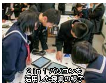
2 in 1パソコンを 活用した授業の様子