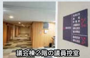
議会棟2階の議員控室