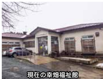
現在の幸畑福祉館

Q 平成10年第2回定例会の際に改善を要望した幸畑福祉館が令和2年度に改築予定とのことであり、大変うれしく思いますが、そのスケジュールと内容をお示しくください。