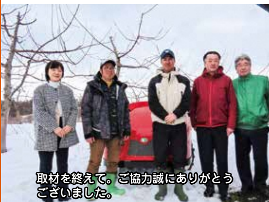
取材を終えて。ご協力誠にありがとうございました。

〔議員〕 貴重な若い世代ですので、市議会としても支援していきたいですね。本日はお忙しい中、ありがとうございました。