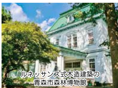
ルネッサンス式木造建築の 青森市森林博物館

A 教育部長 当該事業は、森林博物館を文化財として、将来にわたり適切に保存するために改修工事を実施するもので、主な改修内容として、屋根のふき替え、外壁の再塗装、窓の修復及び窓枠等の再塗装を予定しています。改修工事のスケジュールですが、屋根及び窓の工法については、高度な技術を要し、複数年での工事が必要なため、令和6年度は建物西側、令和7年度は建物中央、令和8年度は建物東側を施工する予定です。