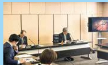
長浜市での視察の様子

※議会BCP：大規模災害時等において、議会の責務を果たすために、必要な組織体制や議会・議員の役割などを定めたもの BCP = Business Continuity Plan（業務継続計画）