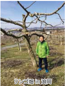
リンゴ畑 in 浪岡

ンゴを含む果実の産出額は43億5千万円で、農業産出額全体の約41%を占めている一方、生産者の高齢化や後継者不足による担い手不足が進んでいる状況です。市では、担い手の育成確保や経営支援等により経営体質の強化に取り組んでいるところであり、今年度からは、わい化栽培や高密度栽培などの省力化栽培に取り組む生産者を対象に、省力化栽培りんご園地環境整備事業を実施しています。