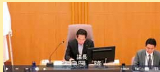
これより令和5年第3回青森市議会定例会を開会いたします。

表示させる字幕については、「青森市議会会議録」を用いており、字幕付き録画映像はおおむね3か月程度でご覧になれます。ぜひ、ご利用ください。