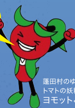
蓬田村のゆるキャラ トマトの妖精 ヨモットくん