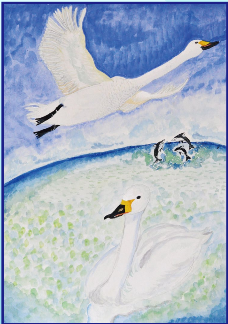
令和5年度 むつ湾を守るポスターコンクール 最優秀賞作品「むつ湾の好きなもの」