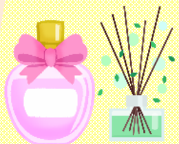
香水・フレグランス