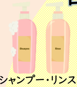
シャンプー・リンス