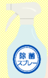
除菌・消臭スプレー

化学物質過敏症は、わずかに化学物質に接しただけで様々な体調不良をきたしてしまう病気です。誰もが安心して暮らせる社会をつくるために、香り付き製品などの使用に当たっては、周囲へのご配慮をお願いします。