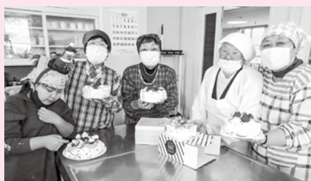
▲横内地区 ほのぼの交流会 一人暮らしの方々と一緒にケーキ作り

これからも、見守りが必要な世帯への声掛けはもちろん、登下校の子どもの見守りにも力を入れていきます。みなさん、困りごとがありましたら、気兼ねなく、私たち民生委員に相談してください。