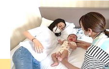
助産師による産後ケア