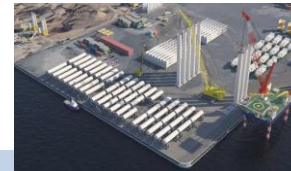
基地港湾のイメージ図