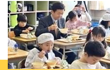
小学校の給食（西市長参加）