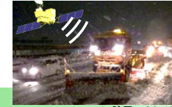
ICT除雪のイメージ図