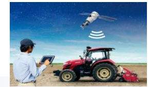
スマート農業のイメージ図