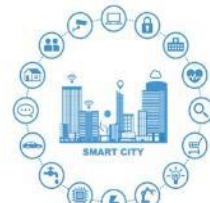
スマートシティのロゴマーク

■ 「 DX先進都市 青森市 」の実現に向け、デジタル技術や外部人材等を活用し、「 市民力+民間力 」により、地域課題の解決や新たな価値を創出する スマートシティ をはじめとする DX を推進