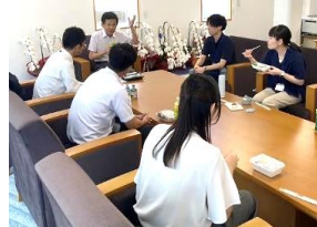
市長と職員のランチミーティング

■ 1on1ミーティング やワークショップ形式の研修などによる、政策立案能力の向上及び職員同士のコミュニケーションの活性化