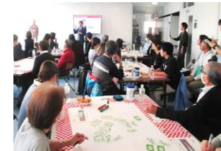
あおり未来ミーティング

■ みんなで対話を深める「あおり未来ミーティング」 などにより、 未来志向の新たなアイデア を把握し、市政に反映