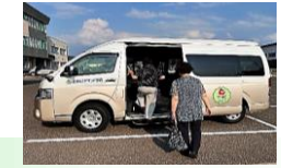
浪岡AIデマンド交通