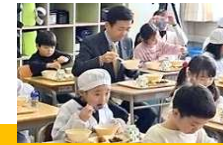
小学校の給食（西市長参加）