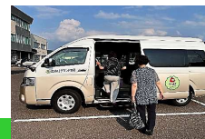
浪岡AIデマンド交通