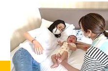
助産師による産後ケア