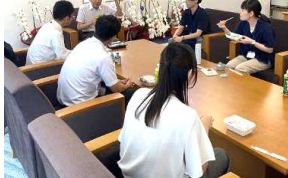
市長と職員のランチミーティング

■ 1on1ミーティング やワークショップ形式の研修などによる、政策立案能力の向上及び職員同士のコミュニケーションの活性化