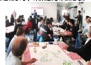
あおり未来ミーティング

■ みんなで対話を深める「あおり未来ミーティング」 などにより、 未来志向の新たなアイデア を把握し、市政に反映