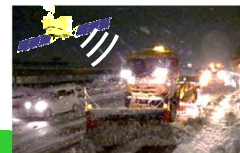
ICT除雪のイメージ図