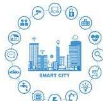
スマートシティのロゴマーク

■ 「DX先進都市 青森市」 の実現に向け、デジタル技術や外部人材等を活用し、 「市民力+民間力」 により、地域課題の解決や新たな価値を創出する スマートシティ をはじめとする DXを推進