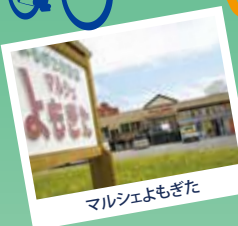
マルシエよもぎた