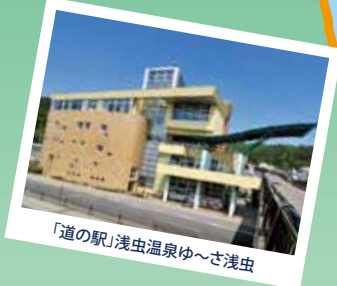
「道の駅」浅虫温泉ゆ〜さ浅虫