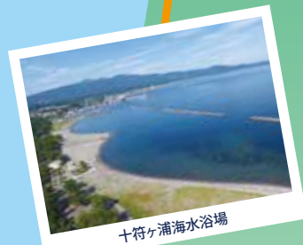
十符ヶ浦海水浴場