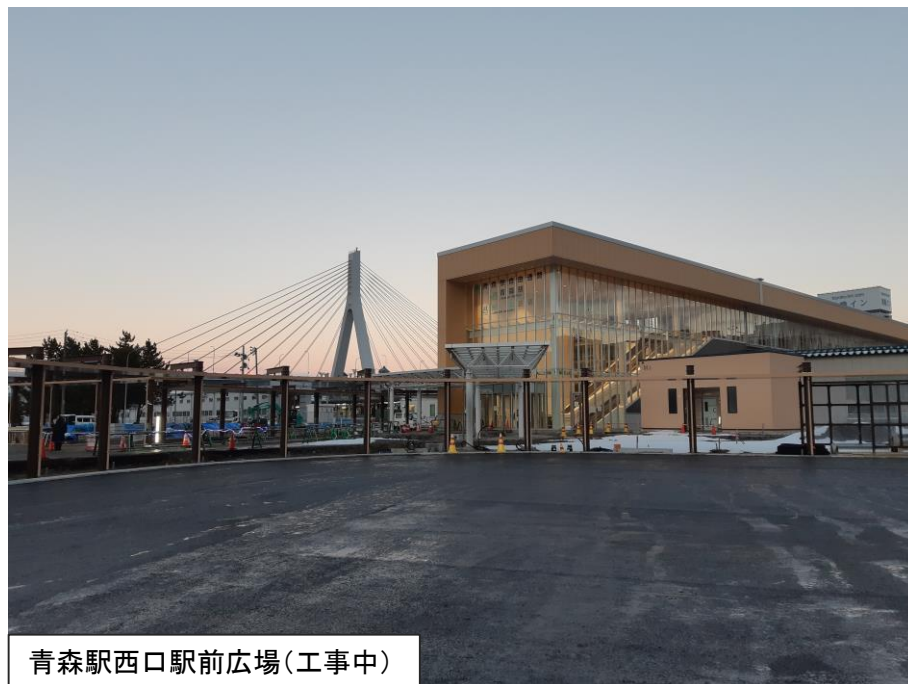
青森駅西口駅前広場(工事中)