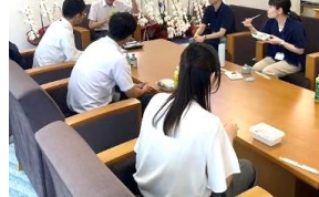
市長と職員のランチミーティング

■1on1ミーティングやワークショップ形式の研修などによる、政策立案能力の向上及び職員同士のコミュニケーションの活性化