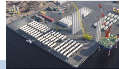
基地港湾のイメージ図