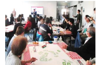
あおもり未来ミーティング

■みんなで対話を深める「あおもり未来ミーティング」などにより、未来志向の新たなアイデアを把握し、市政に反映