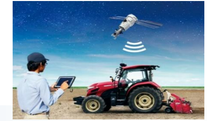
スマート農業のイメージ図