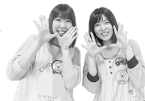
つどいの広場「さんぽぽ」スタッフ