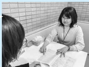
保健予防課 精神保健福祉士