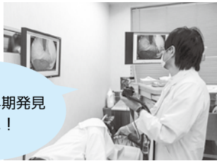
胃がんの早期発見 早期治療に！