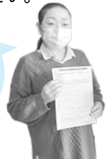
感染症対策課 看護師