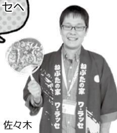
ねぶたの家ワ・ラッセ 佐々木