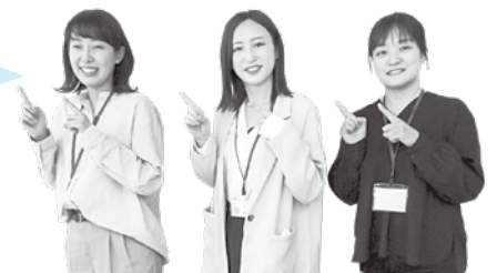
健康づくり推進課 保健師