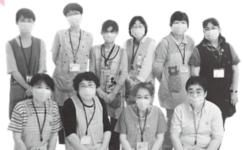
子育て応援隊のみなさん