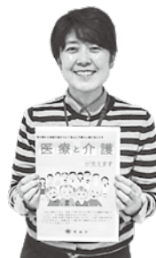
高齢者支援課 スタッフ

身体の状態に合わせ、日常生活の自立を助ける用具（車椅子、ベッド等）の貸与を行います。