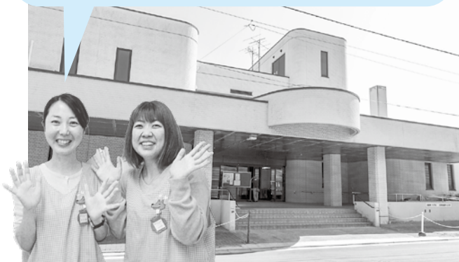
あおもり親子はぐくみプラザ 保育士

8月の『子ども発達相談』は、「総合福祉センター」で開催します。あおもり親子はぐくみプラザではありませんので、お間違えのないよう、ご注意ください。