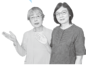
青森市読書団体連絡会のみなさん