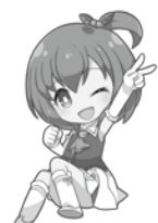
青森競輪場 イメージキャラクター 葉 萌輪

競輪は適度に楽しみましょう。車券の購入は20歳になってから。車券発売状況についてはお問合せください。