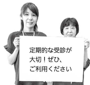
健康づくり推進課 健診・検診受付スタッフ