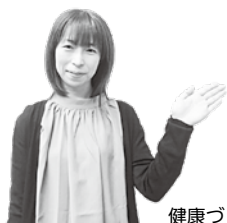
健康づくり推進課 健診・検診受付スタッフ