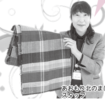
あおり北のまほろば歴史館スタッフ