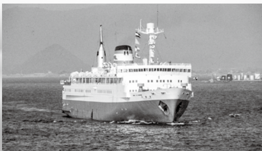
▲津軽丸II 旅客を乗せる船としては最後の型の津軽丸型。そのなかの第一船。