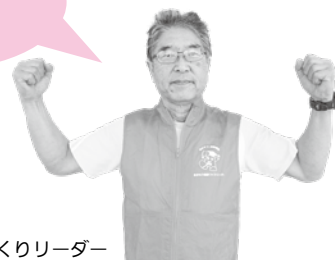
あおもり健康づくりリーダー