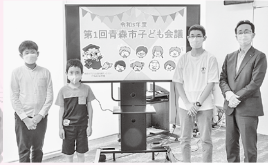
令和3年度 第1回青森市子ども会議

青森市子ども会議公式Instagram▲ アカウント名@aomori.kodomokaigi