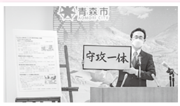
2月14日、市長記者会見。街を守りながら反転攻勢の芽を育む「守攻一体」型予算を発表しました。

2月10日、自宅療養者健康観察センターを新設。保健部感染症対策課(110人)に30人の職員を追加配置、職員が毎日電話やメールなどで健康状態を確認しています。また、青森市医師会のご協力のもと毎日当番医制による診療体制の確立、パルスオキシメーターの貸出、配食サービスの提供等も行っています。