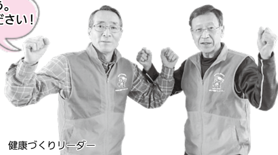
三内・西滝地区 健康づくりリーダー