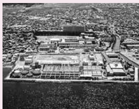
▲八重田浄化センター

地方公営企業法を段階的に適用し財政状況・経営成績の明確化を図ったことや近年の下水道事業を取り巻く環境変化などを踏まえ、将来にわたって安定的に事業を継続していくための中長期的な経営の基本計画として平成29年2月に策定した「青森市下水道事業経営戦略」の改定をするものです。