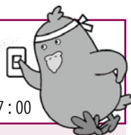
東北電力キャラクター 「マカブウ」