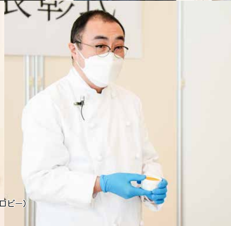
写真: 令和4年度青森市匠の職人表彰式(1月18日/本庁舎1階ロビー)